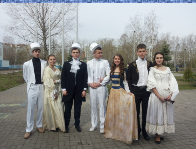
Республиканская НПК им. Л.Н. Толстого (встреча гостей)