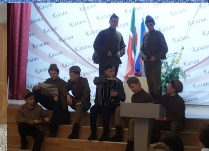
Литературная композиция «Василий Тёркин»