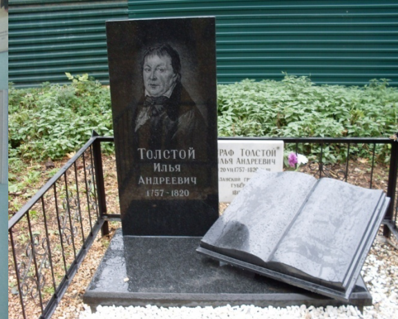
Могила прадеда Л.Н. Толстого под патронажем учащихся гимназии