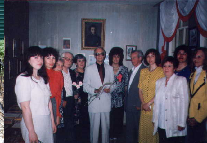
Встреча с потомками А.С. Пушкина в школьном музее